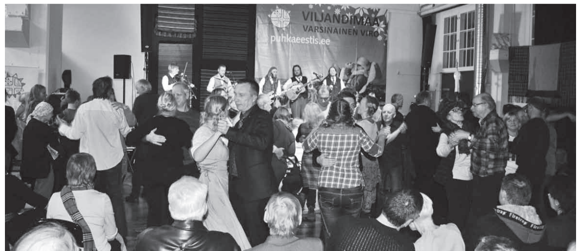
Ku Untsaka püüne pääle tullive, olli kohe tantsulats rahvast täis.