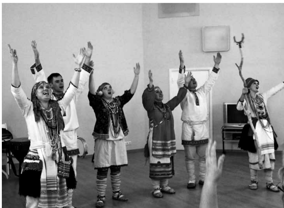
Ansambel Merema.

Ää om miilde tulete kah minevaastest õimunädälit: noor-detuan pikä lavva taga istsive eri põlvkonde inimese ja kigile uut-medet võtivate lauluviisi üles just kige noorembe osavõtja – I lassi