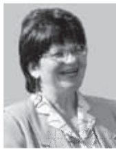
Alli Laande mulgi keele õpetei

Vāegā tāhtis om ollu selle edimese keelepēsā man sii, et mõlempel puul om asutise juhi ja tüüteje vāegā lāmmelt suhtunu selles, sest ilma ei oles sii võimalik. Ka rühmā kasvateje om innuge asja man ja toes mulgi tädil. Sihandse rojekti mõte om egā kuu ütēl päevā lasteaia laste manu tuvva mulgi kõnekiil, midā mulgi keelepēsā tädi kõnelep kik sii aig, ku lastege rühmān om. Selle manu käip kah ommukutunn ütē laulu ja māngege. Egā pāe om oma teema ja latse saave tutves nii Mulgimaa kihelkundu, lipu, rōōvide, kombide ku ka keelege. Latse tunneve joba peris pallu sõnu ārā ja ei ole viil ollu tunnet, et na ei