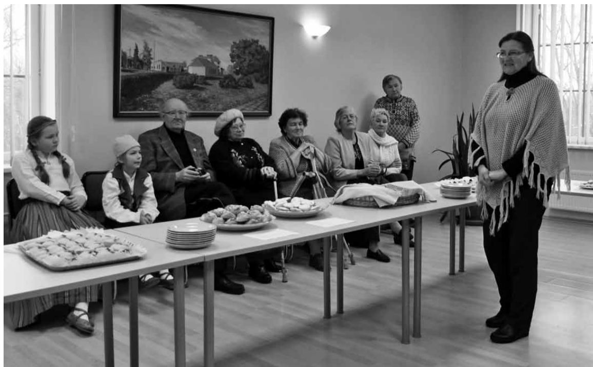
Palu Olga kõnelep, kudas temä oma korbi valmis tei.

Aga mede kodun panti iki paksupiima ja mannaputru mõlempit kõrrage ja ütepallu.