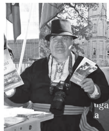
Mulgimaa vanemb Enn V ek Enn Mihailov.

Aituma ennest miu mulke vanembes ollu Karu Alarile, kes tei kõvaste tüüd ja ai süämege mulgi