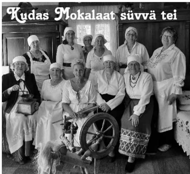
Peedisiirupi ja pallude tõiste mulgi süüke tegemise pannive Mokalaada naise kah DVD laadi pääle. Laati saap Karksi valla kultuurikeskusest.