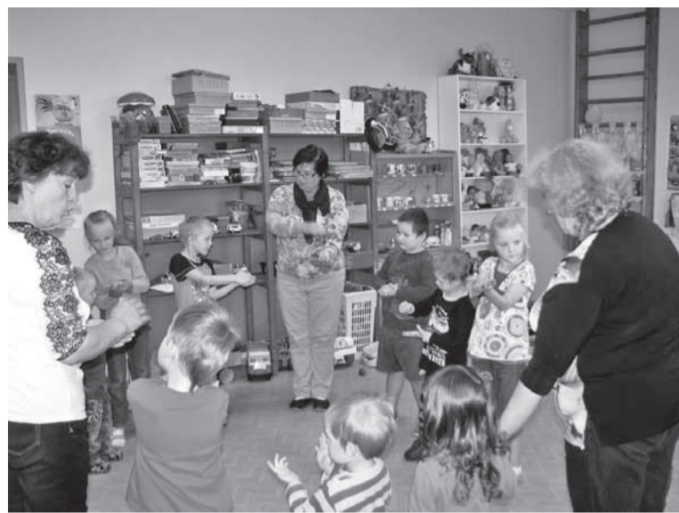
Keelepēsā tunn Ala Pōhikooli lasteaia rühmān.

Karlige ūliōpilastel mulgi kiil ja kultuuri õpete. Kigepāāld tulli kursusest osa saame viistōisku nuurt, aga alle jāi kaitstōisku. Sihandē õpe olli peris kiirkursus, mille aal anti ūte semestregē ūlevaade kigist mulgi keele erisustest ja kah raasike sõnavara. Noore saive ütēl päevā sõita kah sōōri Mulgimaa pāāļ ja vaadete kikki kihlkundi. Miut panni imesteme sii, et noore ollive asjast peris uvitet ja vōtīve keele õpmist vāegā tōitselt. Kah kik kodutse tūū ja arjutise teive na