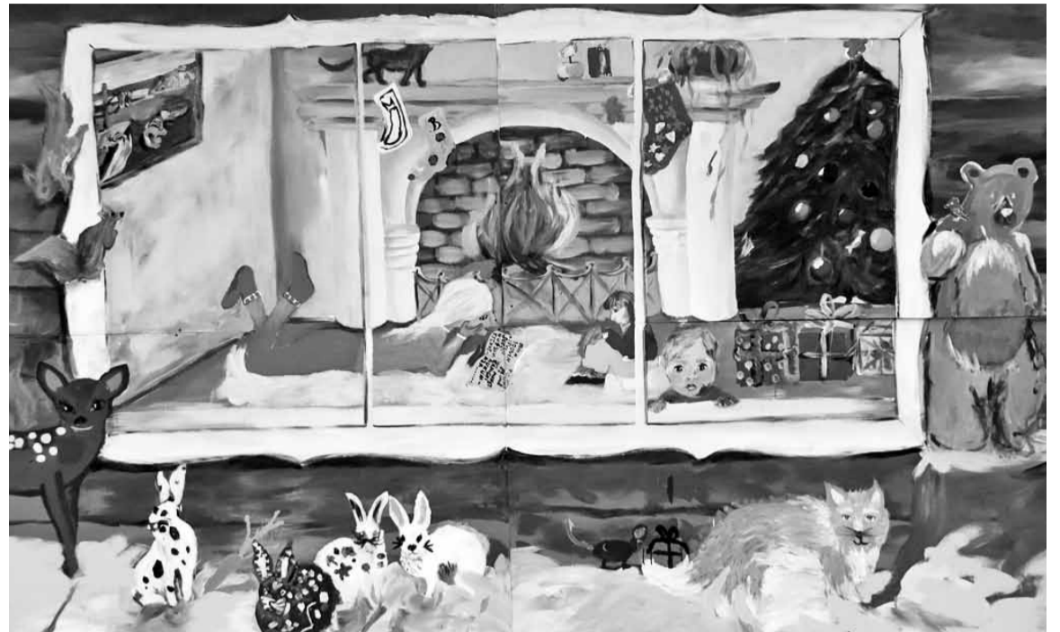
Tarvastu kunstikooli laste üttenkuun tettu jõulupilt.

Päkäpikupapa ringuts mõnusest ja lükäs paksu teki päält, aig olli argi ala aia. Kõögist tullu joba ääd kohveaisu, mammi olli pannkuuke raadin ja kohvi valmi tennu. Päkäpapi akas ommukusüüki süüma. Kõtt täis, läits papi ussest vällä, nende kodu olli paksun mõtsan suure tõrvatse kannu all. Satte paksu valget lume, jõuluaig es ole enämb kaugel. Vana päkäpikk läits talli manu, mis olli tõise kannu all, sääll ollive nendel obese. Obese söödet-joodet, sääds papi ennest lastel kommi ja kiket ääd viimä ja vaateme, kun om ää ja kun alva