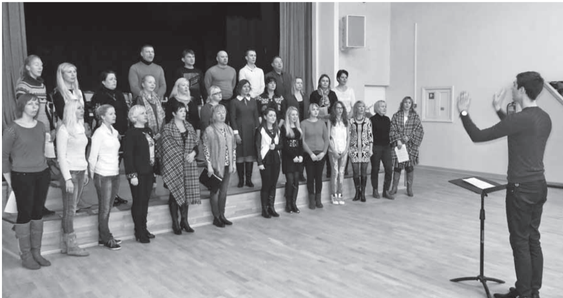
Mulgi laulukoor Mustla rahvamajan laularjutusel.

O ktoobreku lõpuotsan sai Paistun edimest kõrda kokku Mulgi ühendkuur. Nüüd om kokkusaamisi joba mitu ollu ja edimene ülesastmine kah kokku lepit.