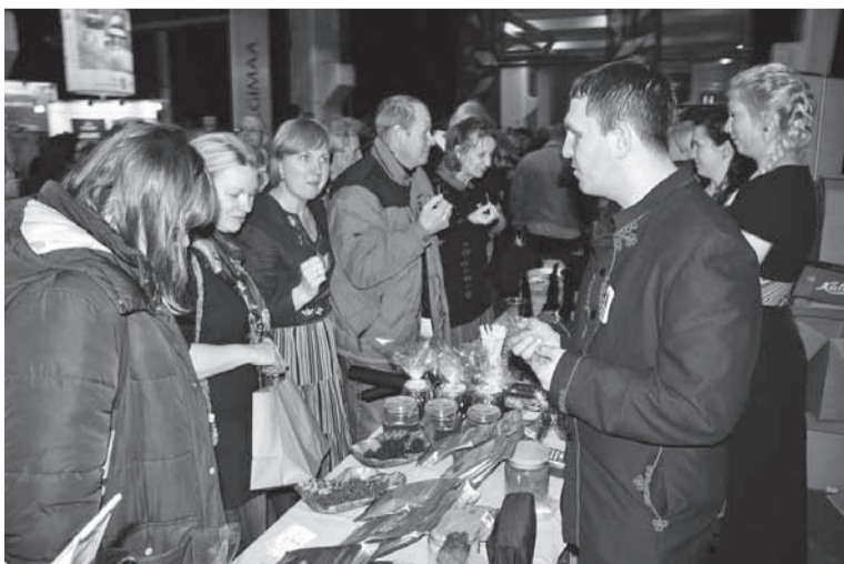
Märdilaada pääl paksive mulgi oma kige parembet kaupä.